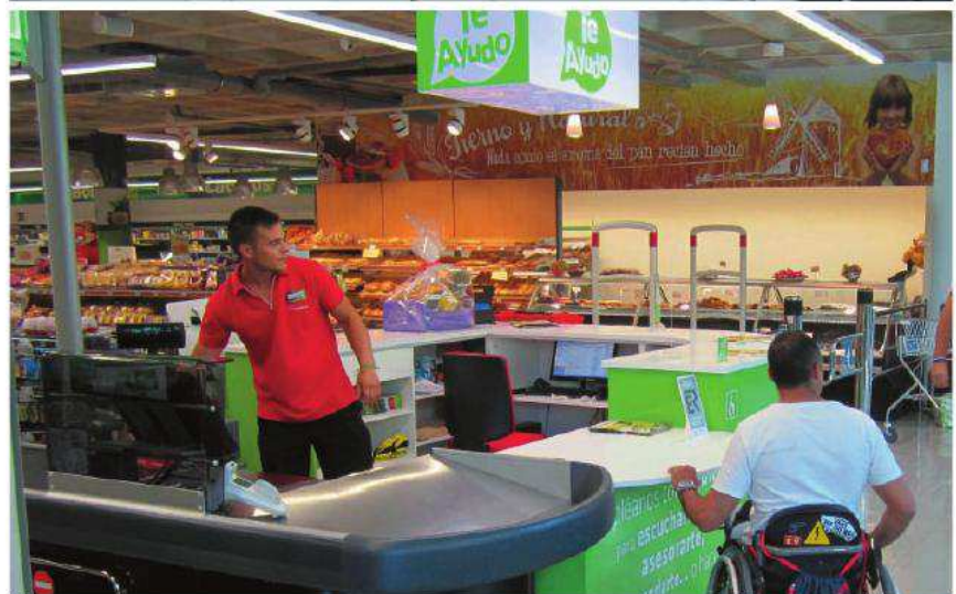
Supermercado Plaza de la Ilusión de Covirán en el que hemos realizado toda la consultoría sobre accesibilidad para conseguir que se convierta en el primer supermercado certificado en accesibilidad universal de toda España.