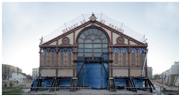
La reforma del Mercat de Sant Antoni ha fet ús de geotèrmia