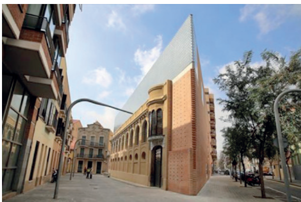
Cristeries Planell al barri de Les Corts de Barcelona