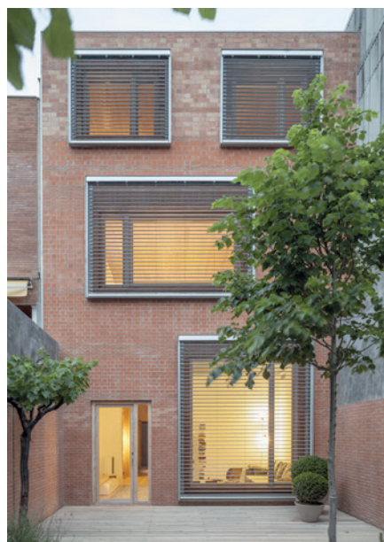
Casa 1014 a Granollers, amb tota una seqüència d'espais bioclimàtics