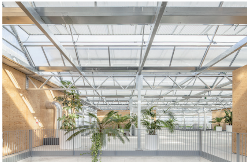
L'ICTA-ICP al Campus de la Universitat Autònoma de Bellaterra incorpora un sistema de geotèrmia que minimitza el consum energètic dels sistemes de climatització

Les seves aplicacions són principalment les instal·lacions domèstiques i comercials amb demanda de calor i fred que utilitzin sistemes de refrigeració i calefacció de baixa temperatura: terra radiant / refrescant, fancoils, etc. i l'aigua calenta sanitària (ACS). Tenint en compte els recursos geotèrmics existents a Catalunya, aquests sistemes es postulen com aquells que tindran una important implantació en un futur.