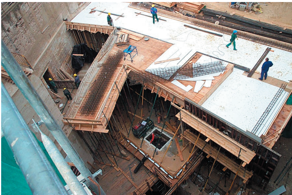
Adecuación del Patio de Armas

Se restauran todos los arcos y huecos situados en la muralla, mediante tableradas de hormigón color imitando al tapial, las bóvedas de los arcos se realizan proyectando hormigón color.