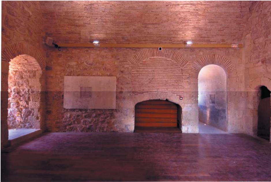
Estado Final de las Obras