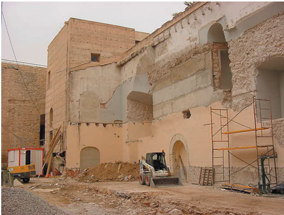
Derribo de las edificaciones añadidas durante el s. XX

Se inicia con la instalación de grúas-torre y ejecución de los cimientos de los muros de contención del Patio de Arma, se procede al picado y limpieza de los paramentos interiores de la muralla que conforma el Patio de Armas de la Fortaleza, utilizando sistemas de restauración similares a los ya empleados en ocasiones anteriores, ejecutando los muros de tapial con hormigón armado color (cemento blanco, arena y canto rodado de río), encofrado con tablero de madera, simulando la textura del tapial y anclaje del tapial islámico mientras que los muros de mampostería (siglo XV) 60% realizados con mortero de cemento color y piedra del propio derribo del Palacio en su mayor parte.