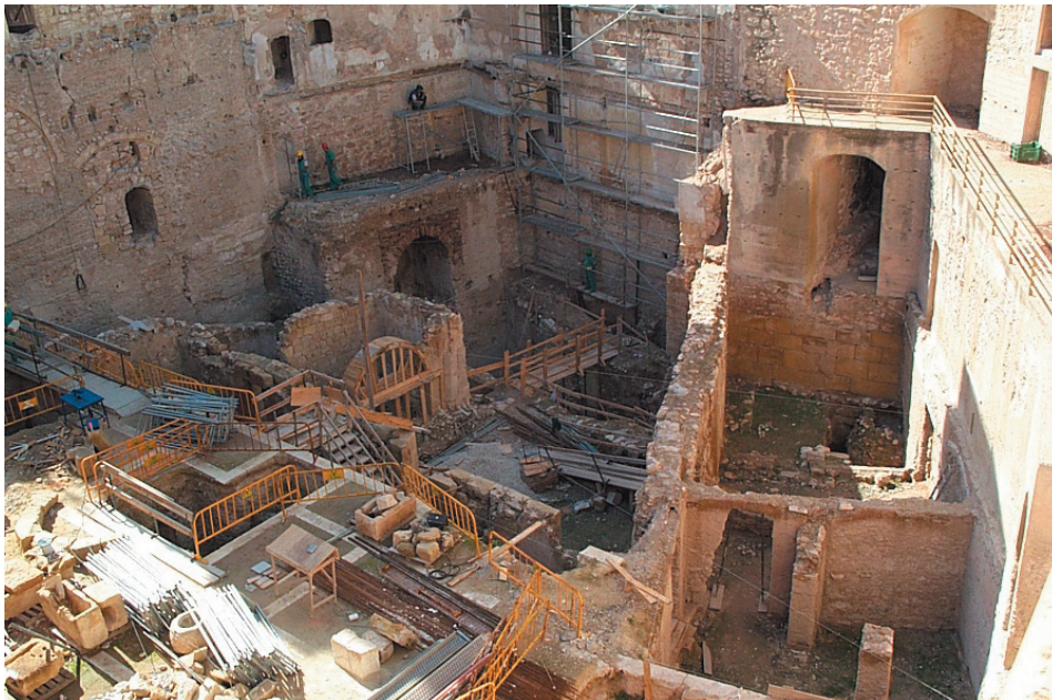
Estado inicial del Patio de Armas

Este edificio se complementa con lo que será el futuro Museo Arqueológico de Elche, situado en la primera planta de sótanos del parking de la Plaza de Traspalacio, conectándose ambos mediante pasarela que accede al Palacio de Altamira a nivel de planta de sótano del Patio de Armas.