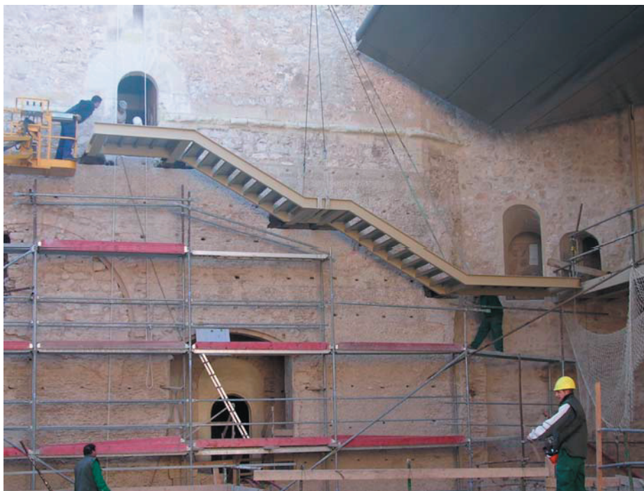
Escalera de acceso a la Torre del Homenaje.

Se han colocado escaleras de acceso a los distintos niveles, realizadas con hormigón visto color o metálicas con barandillas forradas total o parcialmente en acero cortén con pasamanos en madera de IPE y huellas en hormigón visto, forradas con piedra caliza Alcor (6 cm.) o mediante pletinas metálicas perforadas y galvanizadas, soldadas directamente a los perfiles metálicos.