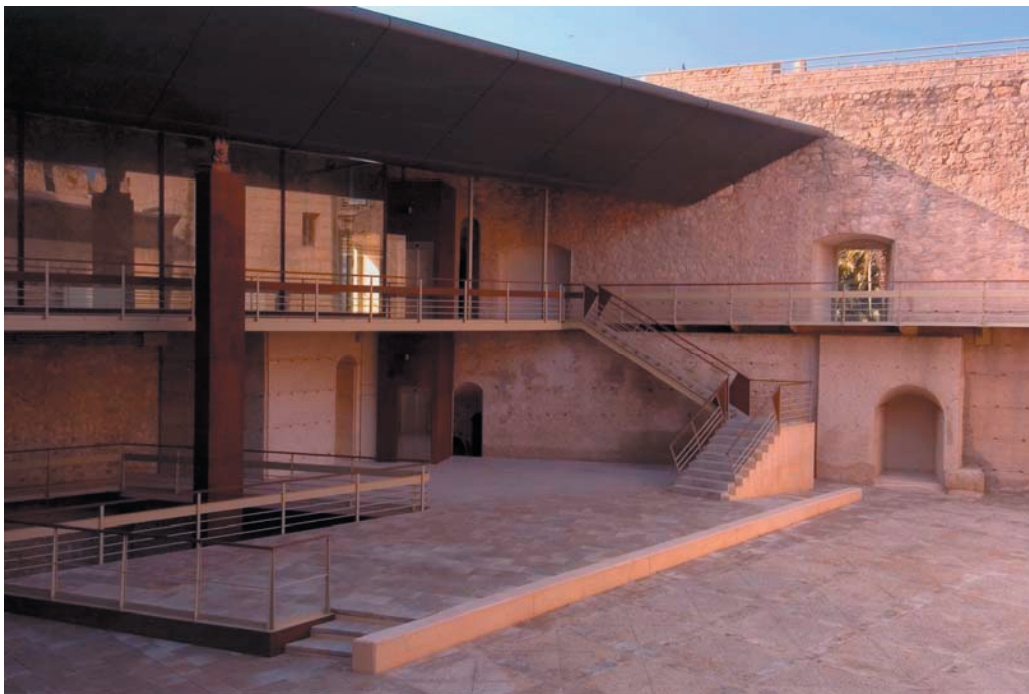
Estado Final de las Obras