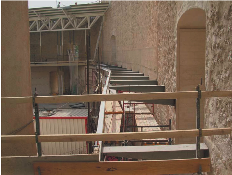
Corredor del muro perimetral