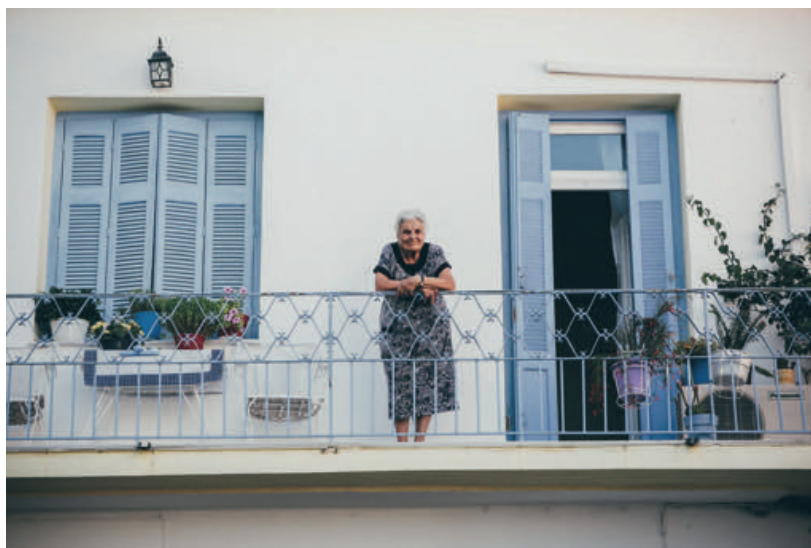
Les persones grans necessiten disposar d'un habitatge que estigui adaptat a les seves necessitats

Segons el Pla Nacional d'Accessibilitat 2004-2012 2 , les persones que a Espanya tenen discapacitats permanents derivades de deficiències físiques, sensorials, mentals, etc, són 3,5 milions i representen el 8,8% del total de la població. Per altra banda, les persones d'edat avançada no discapacitades (65 anys o més) són 4,4 milions de persones, i representen el 10,9% de la població. També hi ha les persones que tenen circumstàncies transitòries derivades d'activitats o situacions conjunturals que resulten discapacitants per a elles. Entre aquestes, hi tenim les persones amb discapacitat transitòria física: 1,3% de la població i altres que en algun moment de la seva vida passen per alguna circumstància discapacitant: 17,7% de la població. Per altra banda, cal tenir en compte les dones embarassades: 0,5% de la població. Tots aquests col·lectius representaven l'any 1999, prop de 16 milions