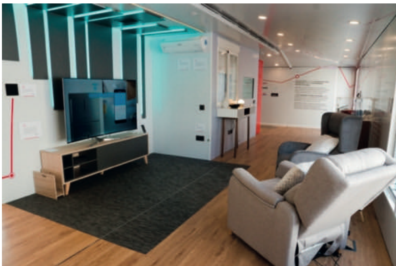
Prototip de la Fundació ONCE d'adaptació funcional de saló menjador

ment i pel tacte, i estar properes per evitar desplaçaments. És recomanable instal·lar detectors de fum, gas, fuites d'aigua, caigudes, etc, connectats a alguna central d'alarma o sistema domòtic de l'habitatge, així com disposar d'algun sistema per estar comunicats amb l'exterior, com un telèfon o l'interfon del porter automàtic, que puguin ser utilitzats en cas de risc.