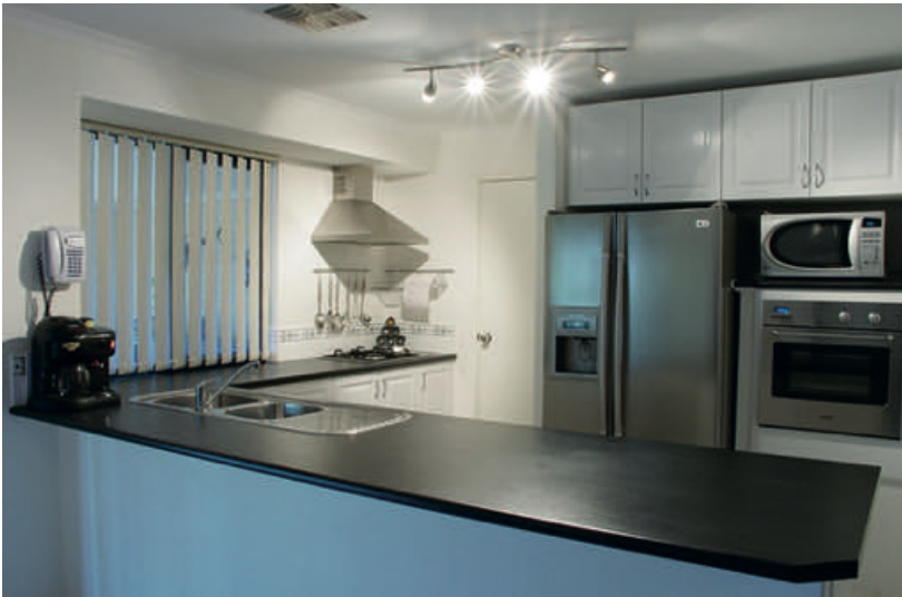
La cuina és un altre dels espais de la casa on es fa vida comunitària i cal tenir cura de la distribució dels diferents components