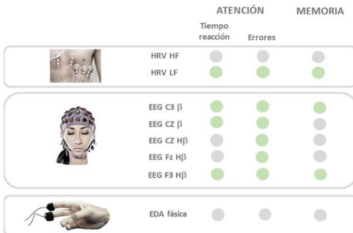
Fig. 2. Combinación de métricas neurofisiológicas integrantes de los índices cognitivos de atención y memoria

Las siguientes métricas neurofisiológicas permitirían registrar datos sin posibilidad de manipulación por parte del sujeto y en tiempo real.