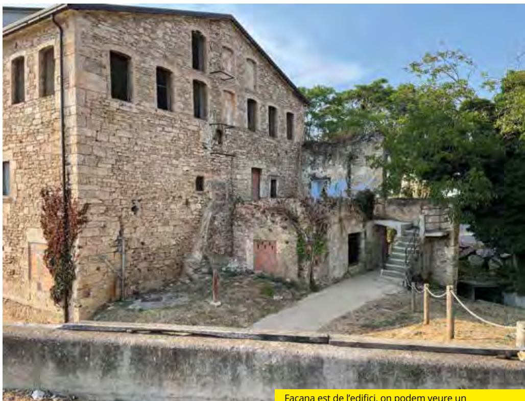
Façana est de l'edifici, on podem veure un detall del rec actual.