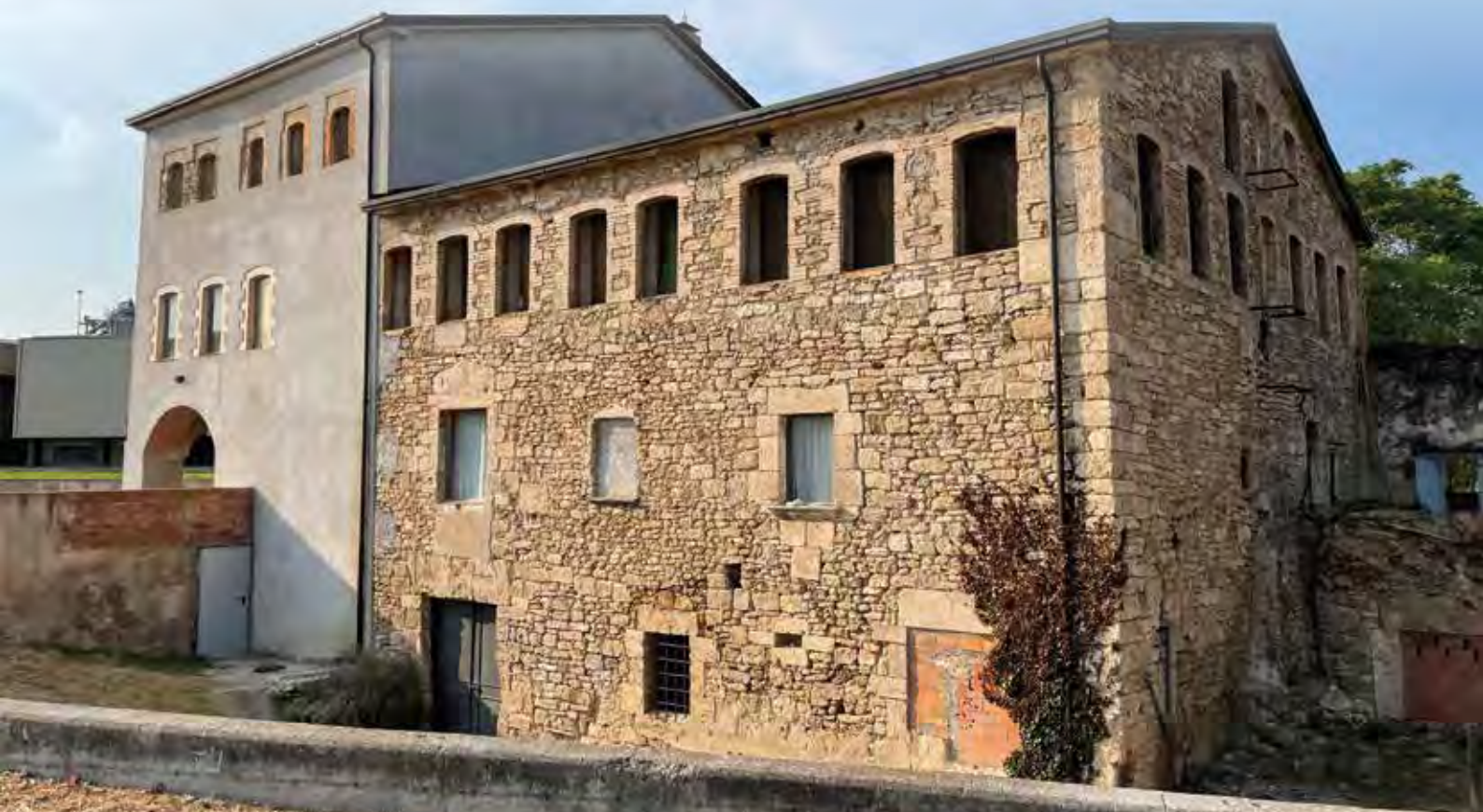
Façana sud, vista de diferents "aparells" constructius.

Sobre l'època de construcció d'aquesta gran ampliació es pot concretar una mica més del que els sistemes constructius denoten, ja que en el decurs de les primeres obres de restauració van aparèixer dues dates en els guixos interiors, una de les quals està situada en una de les parets de la petita estança que podria ser anterior a l'ampliació i que es va incorporar juntament amb el primer edifici de la farga.