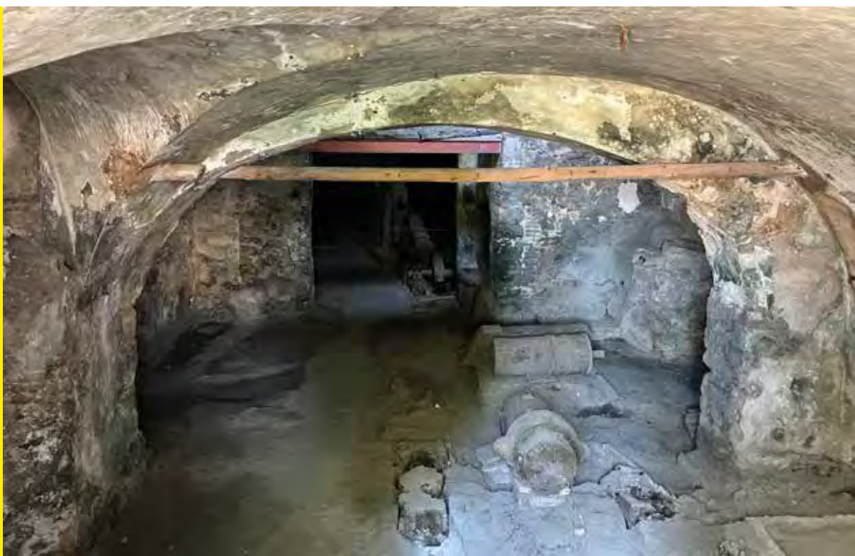
Interior de la zona de treball a on s'ubiquen els martinets.

Aquesta ampliació presenta tipologies constructives diferents respecte a l'anterior ampliació. És una millora constructiva on s'hi afegeix el totxo massís en