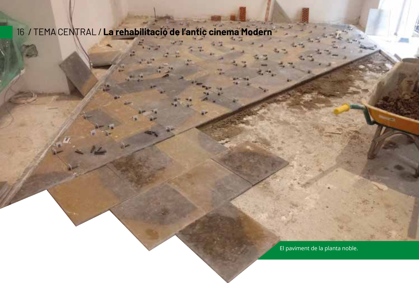
El paviment de la planta noble.

pot arribar a evocar, en la seva doble tonificació (però amb un caràcter molt més orgànic), el "damero" existent. El vàrem trobar sota el paviment de goma "Pirelli" del cinema, en estat molt difícil de recuperar. Les dimensions de les peces, de quaranta per quaranta, es varen escollir ateses les grans dimensions dels espais, molt més proporcionades que les antigues peces de mosaic existents, de vint per vint, que proporcionaven un aspecte ja decadent.