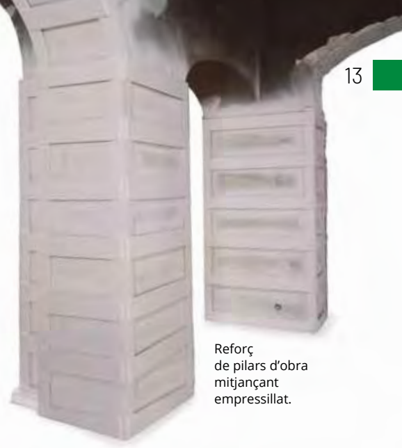
Reforç de pilars d'obra mitjançant empessilat.

Tan sols a la planta baixa apareixen dues voltes que són de pedra, suportades en parets també de pedra (que es pressuposaven de ceràmica), que han resultat estar en molt bon estat. S'han pogut repicar, netejar i deixar a la vista. La seva posició ocupa la