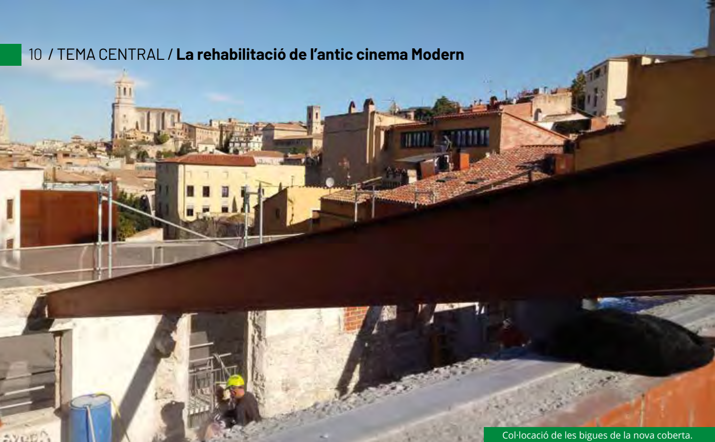
Col·locació de les bigues de la nova coberta.