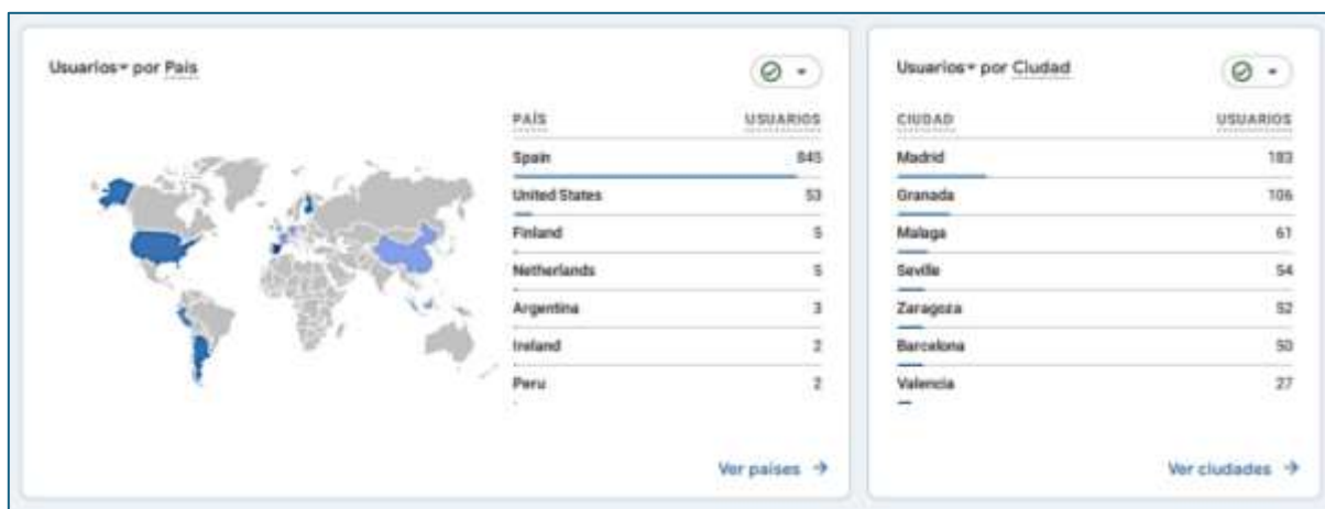
Figura 2. Usuarios de la landing page por país y por ciudad.

Tras el análisis de la landing realizado con Google Analytics [5], desde el 01/10/2023 al 15/01/2024, se ha obtenido un volumen de tráfico con 924 nuevos usuarios (845 de España, 53 de Estados Unidos, 5 de Finlandia, 5 de Países Bajos, 3 de Argentina, 2 de Irlanda y 2 de Perú), con un tiempo de interacción medio de 1 min y 09 s. A nivel nacional el mayor número de usuarios se localizan, 183 en Madrid, Granada 106, Málaga 61, Sevilla 54, Zaragoza 52 y Barcelona 50 (Figura 2).