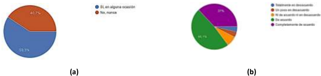
Figura 5. Landing page: (a) Descarga documentación. (b) Utilidad de la herramienta.

Hay que destacar que el 59,3% de los profesionales que han visitado la landing se han descargado algún documento, estando en un 85,1% de acuerdo o muy de acuerdo en que la landing page “NUEVOS TIEMPOS PARA LAPREVENCIÓN. Hacer de las obras lugares de trabajo seguros” es una herramienta útil para afianzar las buenas prácticas preventivas en el sector de la construcción.