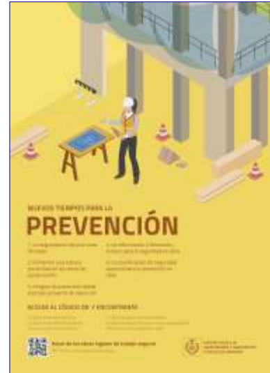
Figura 1. Poster landing page: “NUEVOS TIEMPOS PARA LA PREVENCIÓN. Hacer de las obras lugares de trabajo seguros”

Dentro del apartado Documentación técnica se ofrecen distintas áreas temáticas directamente relacionados con la prevención de riesgos laborales en obras de construcción y donde se analizan las relaciones entre coordinador, empresas y trabajadores autónomos presentes en la obra, detallando los procedimientos documentales precisos para una adecuada gestión de la prevención. Estando disponibles en este momento los siguientes documentos técnicos: