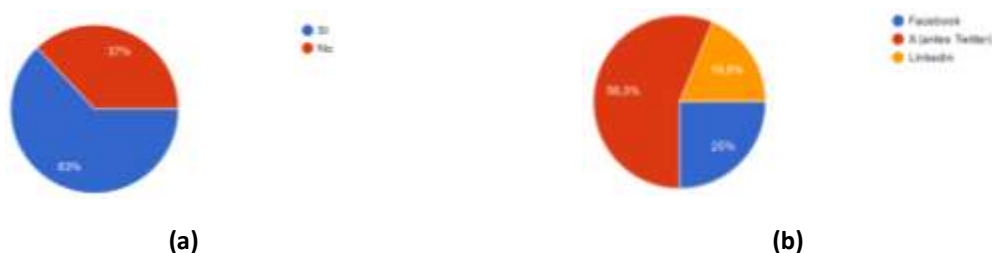
Figura 3. Seguidores Landing page: (a) Redes sociales. (b) Seguidores en X y LinkedIn.

Entre las ventajas [7] de este tipo de encuestas, utilizando Internet para recoger información, podemos considerar la relativa facilidad de aplicación mediante la creación de cuestionarios complejos, en un mínimo tiempo, sin necesidad de tener conocimientos de programación de páginas web. En este sentido, el 63% de las personas que han contestado el cuestionario, siguen la producción de la landing por las redes sociales, en concreto el 56,3% la sigue a través de X (antes conocido por Twitter), y el 18,8% por la red profesional LinkedIn.