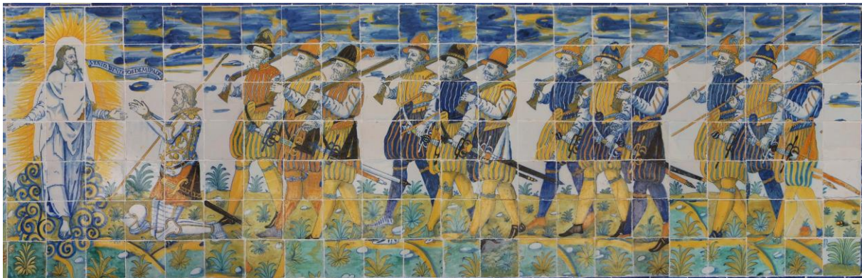
Figura 3. Detalle de la procesión de “Tercios de Flandes ante Cristo” en la actualidad.

El actual panel de Vírgenes y Tercios ante Cristo, en el lado izquierdo del pórtico, está compuesto por 7 filas y 34 columnas, formando un rectángulo de unos 0,98x4,76 m. y una superficie aproximada de 4,66 m 2 [5]. La imagen de Cristo se sitúa en el centro, rodeado de un halo de gloria, con vírgenes [6] procesionando hacia él desde la izquierda y soldados de los Tercios (piqueros y arcabuceros) desde la derecha. A la procesión de vírgenes corresponden las 12 primeras columnas de azulejos para un total de 84 azulejos, mientras que a los soldados las 22 siguientes (154 azulejos). La procesión de vírgenes (mártires), presenta una de ellas arrodillada ante Cristo, seguida de dos grupos de cuatro vírgenes con palmas. En cuanto a los soldados, el primero aparece arrodillado ante Cristo y el resto, en cuatro grupos de tres, con ropas de época y portando arcabuces o picas al hombro. Una simple inspección visual revela los múltiples problemas de montaje que presenta este panel que, al reubicarse en el pórtico de la Basílica, las piezas faltantes o rotas se sustituyeron por otras «similares». Encontramos figuras de «collage» en las que no se mantiene la lógica de su diseño ni la continuidad del dibujo; soldados con zapatos de diferentes colores, mientras que los calzones gregüescos deberían ser del mismo color que las medias, y los arcabuces están extrañamente fusionados con picas (Figura3).