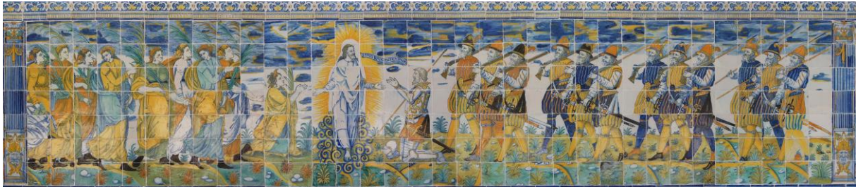
Figura 2. Imagen rectificada actual del panel Vírgenes y Tercios ante Cristo.

documentación previa de las composiciones originales ya que, cuando fueron retiradas las piezas de la Iglesia de San Antonio Abad, este registro no se había realizado. A esto había que añadir que los trabajos de retirada y limpieza de piezas habían sido realizados por personas no expertas en la materia, provocando rotura, fragmentación y hasta pérdida de azulejos originales. Tras más de 50 años de almacenamiento en cajas, nadie recordaba su disposición original. Y con estos antecedentes, se procedió a "crear", entre otros, el actual panel de azulejería devocional que representa a las Vírgenes y Tercios ante Cristo en el pórtico de la Basílica (Figura 2).