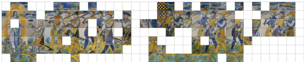
Figura 5. Hipótesis de recomposición de la Procesión de Tercios de Flandes ante Cristo.

Actualmente, en la parte del panel que representa a los Tercios ante Cristo, tenemos cuatro grupos de tres soldados: el primero porta arcabuces, el segundo y tercero portan arcabuces mezclados erróneamente con picas, y el cuarto grupo porta picas. El artista siguió un modelo de soldado al que añadió ligeras variaciones en el dibujo y en el color de la indumentaria para dar más variedad y brillantez a la composición. Por ello, es fácil detectar los errores actuales de continuidad que se cometieron en el montaje de las piezas. Además, con el análisis realizado se han localizado 28 piezas, destacando la aparición de dos músicos (con pífano y tambor) y un portaestandarte. Por tanto, si nos basamos estrictamente en la continuidad de diseño, color y composición, podríamos obtener un panel que pasaría de 22 columnas a 35 (245 azulejos). Pero de esos 245 azulejos, solo tendríamos 155 originales, lo que nos deja con 90 faltantes. Esto daría como resultado una secuencia compuesta por Cristo, el soldado arrodillado con una pica, dos grupos de tres arcabuceros, los dos músicos y el portaestandarte, tres grupos de tres piqueros y un último grupo de tres arcabuceros, con 22 soldados en total y una longitud de 4,90 metros, para una composición de 245 m 2 [10] (Figura 5).