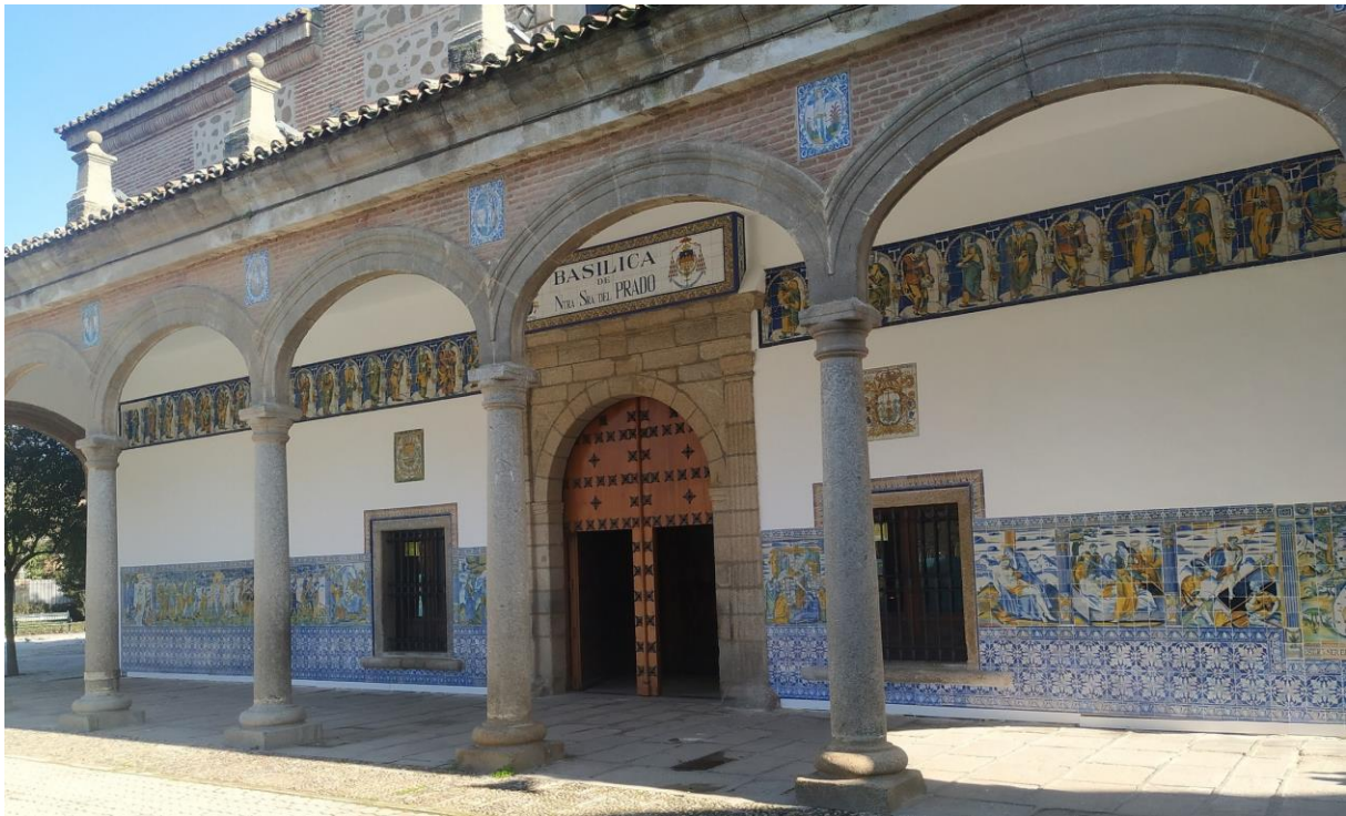
Figura 1. Imagen general del pórtico de la Basílica de Nuestra Señora del Prado.