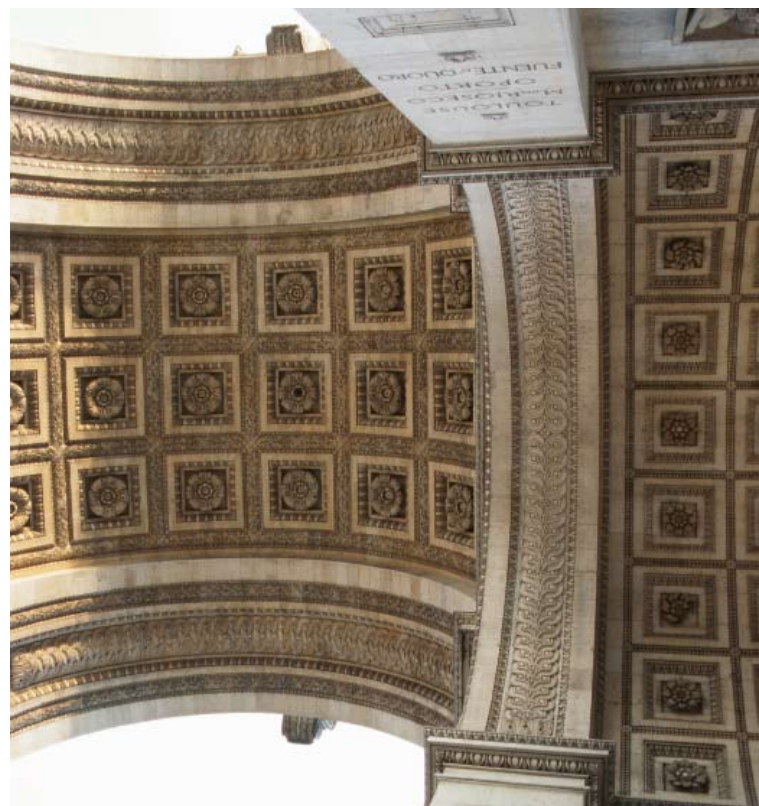
Tres ejemplos diferentes de lo efímero: el hotel de la Basura, instalado en la plaza de Callao de Madrid (izquierda); la plaza Sed, de la Expo de Zaragoza 2008 (derecha, arriba) y el arco de triunfo de París (derecha, abajo).

maciones de los reyes. Las autoridades locales recibían al monarca a las puertas de la ciudad y lo acompañaban en su recorrido hasta palacio. Así entraron los Reyes Católicos en Sevilla, en 1477, por la Puerta Macarena; la reina Margarita de Austria llegó a Madrid en 1649 por la Puerta de Guadalajara; o Carlos III a Barcelona, en 1759, donde en el puerto le esperaba un arco de triunfo con Neptuno, Eolo, sirenas, los cuatro elementos y las estatuas de la Fidelidad y de la Obediencia.