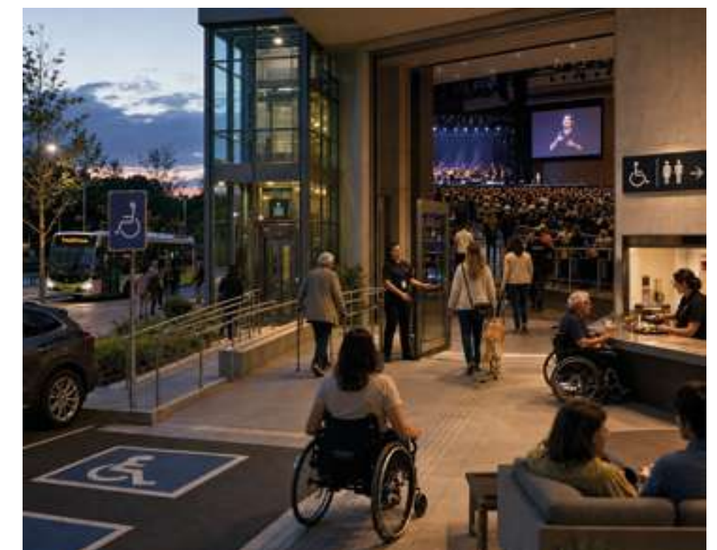
Figura 1. Puntos a considerar en el Plan de Accesibilidad.