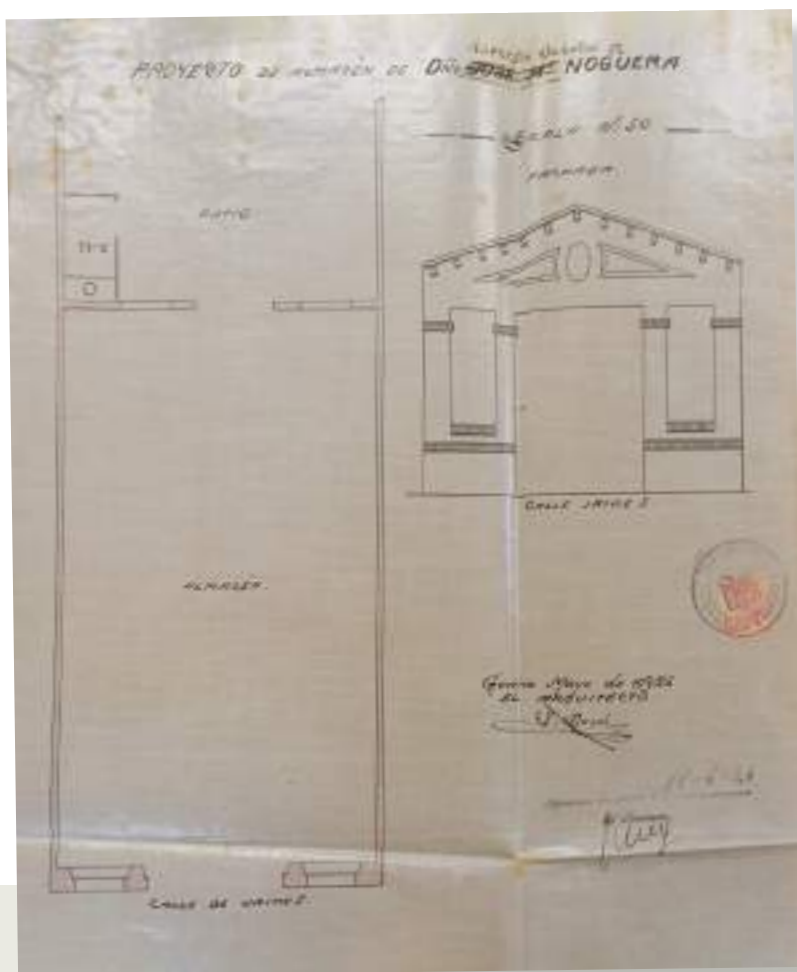
Plànol del magatzem firmat per l'arquitecte Isidre Bosch. Arxiu del Col·legi d'Arquitectes de Catalunya (AHCOAC-G).

Des de ben aviat, Bosch va estar plenament vinculat als canvis de fisonomia de la ciutat de Girona que resultaven de la urbanització dels terrenys agrícoles de fora muralla i de l'emergència de classes benestants que hi cercaven visibilitat. La seva transcendència queda evidenciada en diversos habitatges familiars, com per exemple els que s'articulaven als voltants de l'aleshores recentment creada plaça Marqués de Camps, un dels primers nuclis extramurs que creixia sota la influència de l'estació de tren. Entre 1904 i 1907, va rebre diversos encàrrecs que donaren lloc a les cases modernistes Casa Casellas o edifici Mobles Casellas, el bloc de pisos Marull i la casa del comerciant