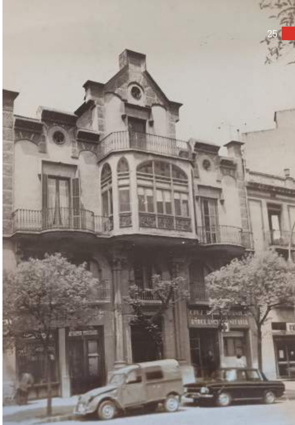
Vista de la casa Noguera – Sabater l'any 1946.

Bosch va multiplicar els projectes també fora de la ciutat. L'any 1915, se li va encarregar la construcció de la nova fàbrica Brilles, Pagans i Companyia de Celrà, convertint-se l'edifici en un destacat exemple de l'arquitectura modernista