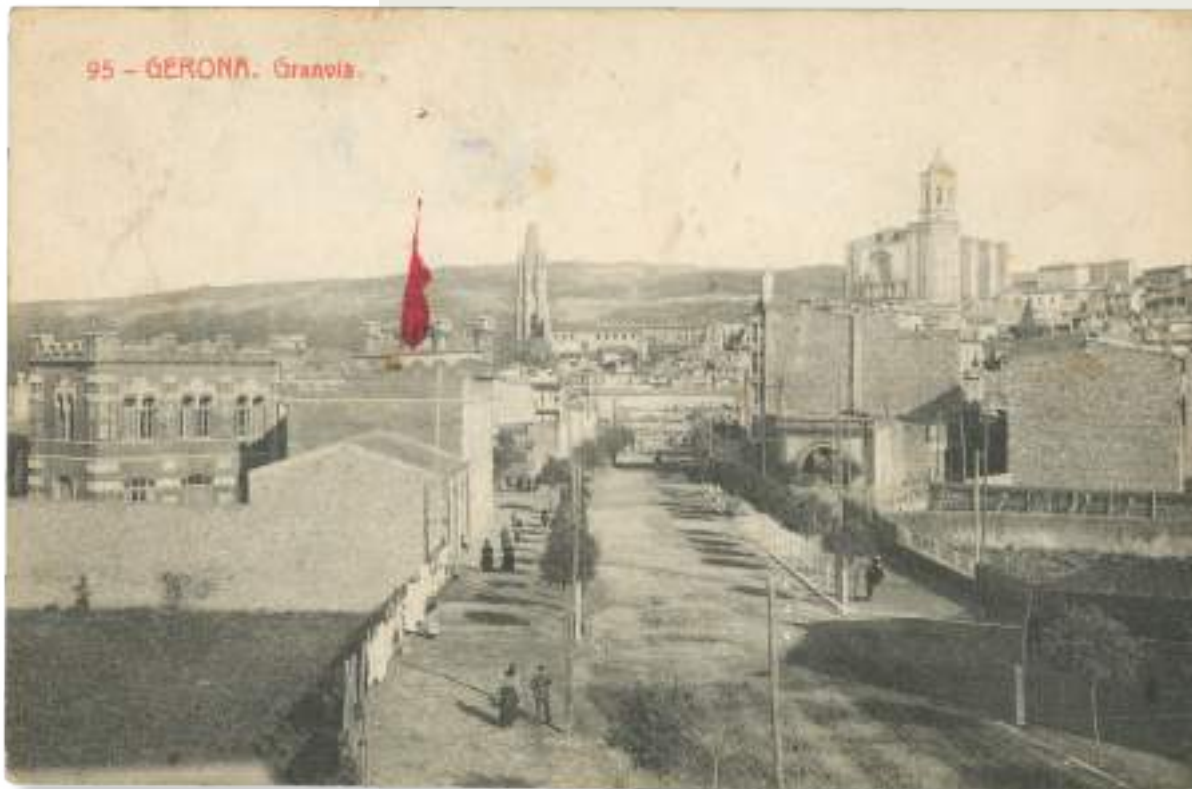
Vista des d'un lloc elevat de la Gran Via de Jaume I. A l'esquerra, l'escola Bruguera i el solar buit a on s'alçarà la Casa Sabater, i a la dreta, el transformador de la Sociedad de Empresas Eléctricas. Al fons, el campanar de l'església de Sant Feliu i la Catedral de Girona. Darrere seu, la muntanya de Montjuïc amb el castell homònim. CRDI, Col·lecció Josep Bronsoms Nadal, 1914.

com a factors desencadenants de noves necessitats i d'una pressió sobre l'espai.