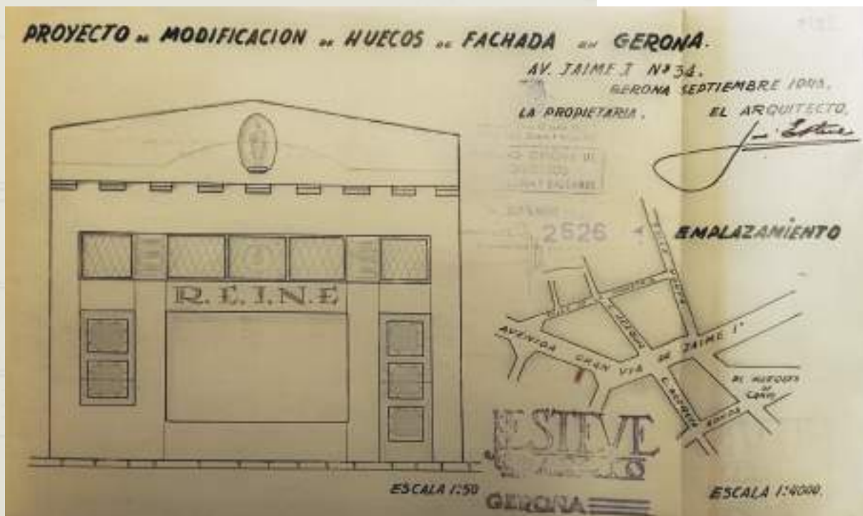
Plànol de la modificació que es realitza a la façana l'any 1946.

Entre les funcions complementàries dels encàrrecs privats i públics, es pot destacar la vinculació d'Isidre Bosch amb l'arquitectura religiosa. Catòlic fervent, havia passat alguns anys de la seva joventut al seminari. Aquest vessant es va consolidar al ser anomenat arquitecte diocesà l'any 1933, càrrec que el va portar a dirigir nombroses remodelacions i reparacions especialment després de la guerra.