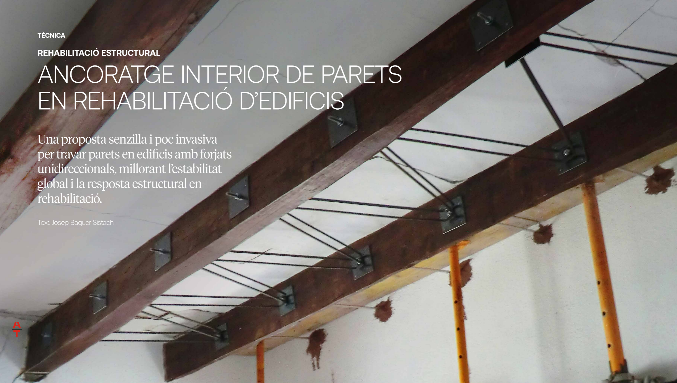
► Biga composta amb triangulacions metàl·liques.

Un dels problemes que se'ns presenta sovint quan projectem o executem obres de rehabilitació d'edificis de parets de càrrega i forjats unidireccionals és la necessitat de travar algunes parets mitgeres o de façanes, situades en el mateix sentit que les bigues dels sostres —per tant, paral·leles a les bigues. Les parets de càrrega en les quals es recolzen les bigues no acostumen a tenir problemes de travat, atès que els mateixos caps dels perfils lliguen transversalment els murs.