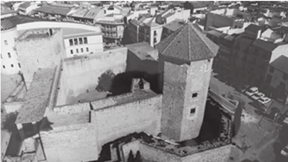
Figura 1. Vista aérea del castillo del Moral en 2004. Autor desconocido.

A diferencia de las otras torres, esta soporta una cubierta inclinada de entramado de cañas con terminación de teja curva, que está sustentada por un pendolón central que recoge el peso de ésta y reparte las cargas sobre cuatro jácenas de madera que la trasladan a los muros. El citado pendolón recoge las cargas del punto medio de la cubierta mediante 18 jabalcones que sostienen los pares en ese punto, dándole la característica forma de paraguas, arriostrándola en los aleros mediante estribos de madera. La torre del Mediodía y La torre de las Damas se encuentran integradas en la muralla, construidas en mampostería. La torre del Homenaje, de planta cuadrada y construida por completo en mampostería, aloja distintas salas del museo.