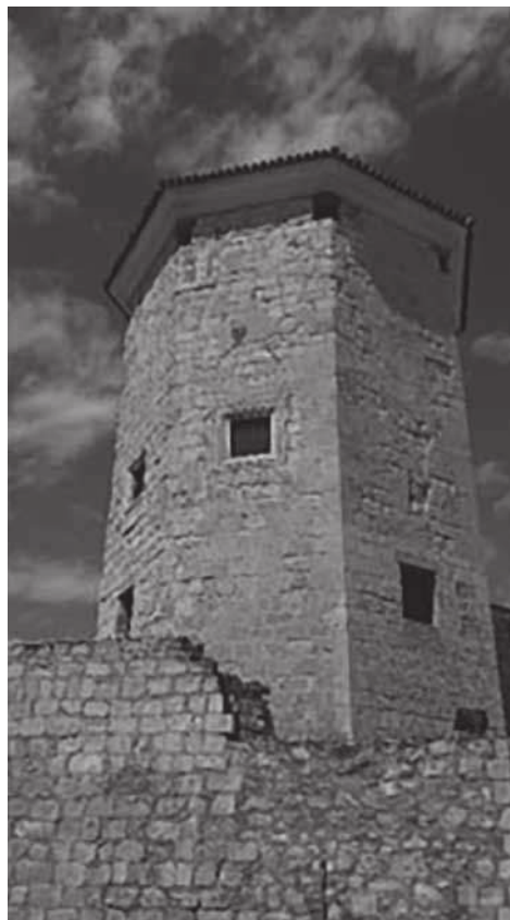
Figura 3. Torre del Moral.