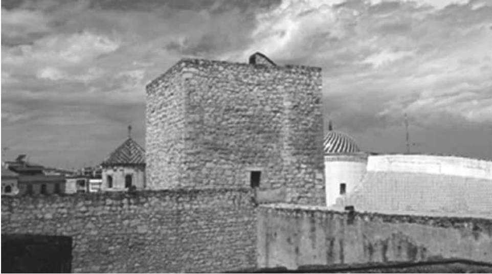
Figura 4. Torre del Homenaje.