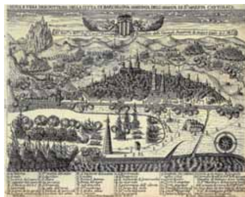
GRAVAT IDEAL DE 1651 ENTRE BARCELONA I LA MUNTANYA DE MONTSERRAT. REPRESENTA LA IMPORTÀNCIA I LA RELACIÓ QUE TENIEN AQUESTS DOS INDRETS