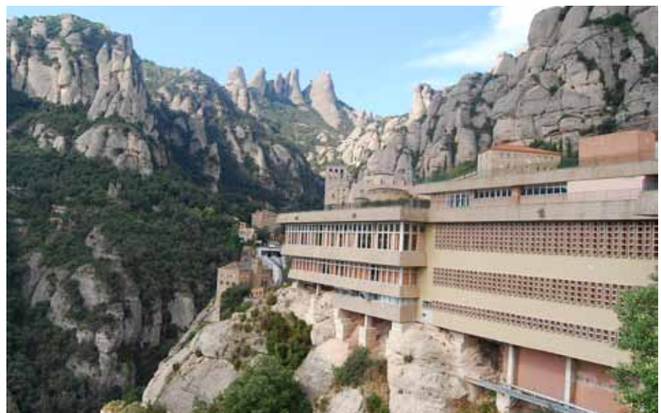
CAS PENDENT DE RESOLDRE: AQUEST ENORME RESTAURANT S'HA GASTAT UN PRESSUPOST MOLT ELEVAT EN LA DARRERA RESTAURACIÓ EN LA SEVA ADAPTACIÓ INTERIOR. OBSERVI'S LA MANCA D'INTEGRACIÓ DE L'EXTERIOR DE L'EDIFICI I L'IMPACTE VISUAL QUE AQUESTA GENERA