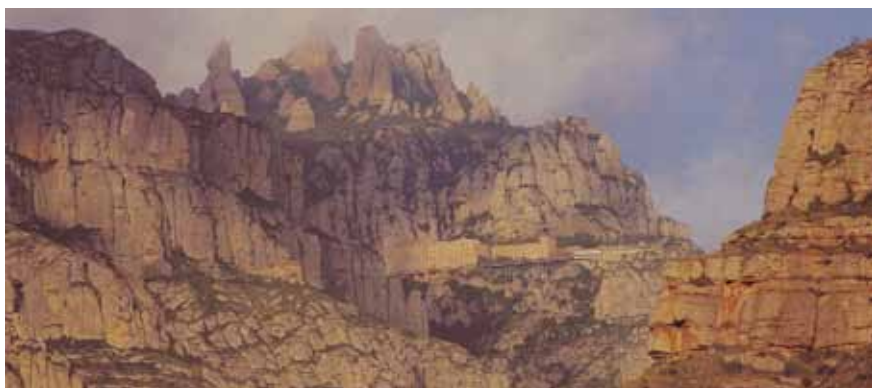
A LA IMATGE CONVERGEIXEN LA MUNTANYA DE GRANS PENDENTS AMB EL MONESTIR. PER LES SEVES CARACTERÍSTIQUES TOPOGRÀFIQUES, AQUESTES CONSTRUCCIONS SEMPRE HAN TINGUT DIFICULTAT D'ASSENTAMENT, DE MANERA QUE ELS EDIFICIS ES CONCENTREN EN PUNTS ESPECÍFICS

La impossibilitat d'obtenir superfícies horitzontals i la manca d'espai han marcat els assentaments del conjunt; sense