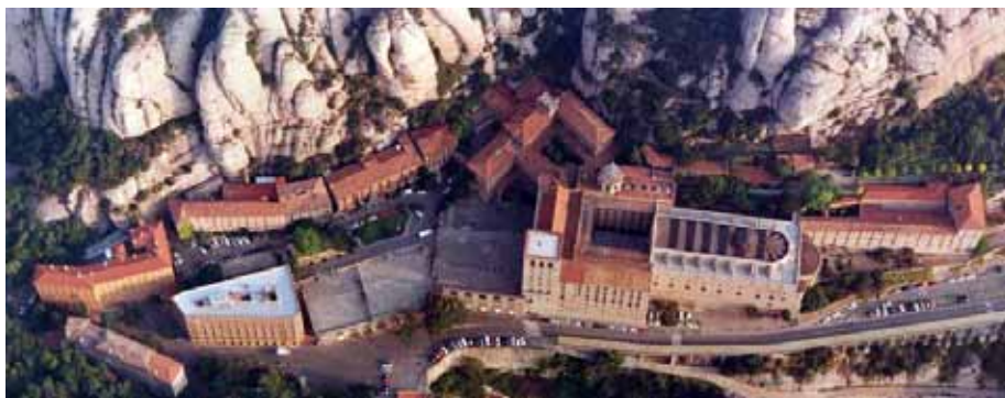
VISTA ACTUAL DEL CONJUNT DE MONTSERRAT, AMB ELS DIFERENTS USOS QUE EXISTEIXE