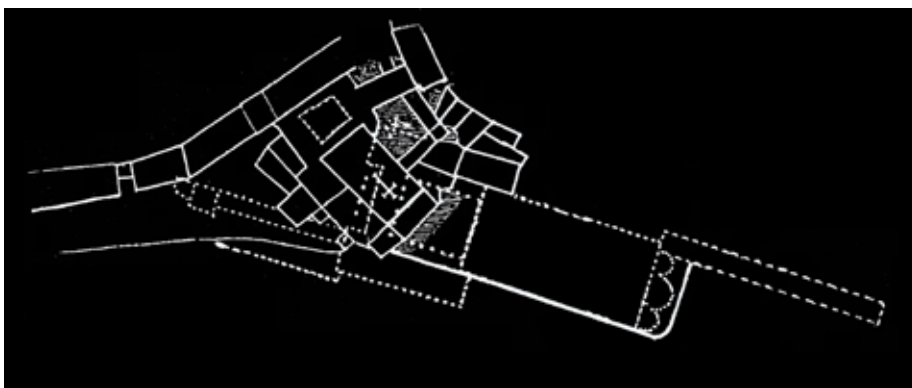
PLÀNOL DEL S. XVIII, EN EL QUAL DESTAQUEN ELS DOS COSSOS DISSENYATS PELS ENGINYERS PER A L'AMPLIACIÓ DEL MONESTIR. PROVIDENCIALMENT, SOLS ES VA CONSTRUIR EL PRIMER COS (QUE ES TROBA ENCASTAT A LA BASÍLICA DEL SEGLE XVI); SI NO, SHAGUESSIN DESTRUÏT TOTS ELS EDIFICIS DE L'ÈPOCA MEDIEVAL