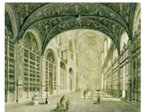
MAGNÍFIC GRAVAT D'ALEXANDRE LABORDE DE 1806; GRÀCIES A AQUESTA REPRESENTACIÓ ES POT CONÈIXER I ADMIRAR LA DECORACIÓ INTERIOR BARROCA DE LA BASÍLICA