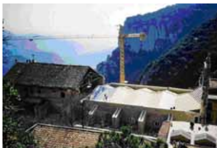
ABANS I DESPRÉS DE LES OBRES DE RECONSTRUCCIÓ DE LA COBERTA (1994). S'APRECIEN ELS CONTRAFORTS, ÒCULS I CIMBORIS RESCATATS