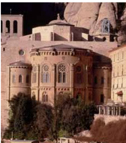
VISTA ACTUAL DE LA FAÇANA POSTERIOR EN QUÈ S'APRECIA EL REMAT DEL PRESBITERI I EL DESMUNTATGE REALITZAT AL TERCER PIS DE L'ABSIS CENTRAL NEOROMÀNIC. D'AQUESTA MANERA, EL CONJUNT VA ADQUIRIR PROPORCIONS MÉS EQUILIBRADES

En la mateixa línia de modernització del santuari, des de mitjan del 2007 es projecta, per a l'interior de la basílica, la construcció d'un nou orgue que situaria el monestir en el mapa dels primers nivells musicals internacionals, ja que l'instrument esdevindrà un dels més grans d'Europa. El sentit d'aquesta operació el trobem en la dilatada tradició històrica montserratina i el paper de l'escolania, des del s. XIII, en la formació de destacats músics i compositors. El nou orgue substituirà l'actual, construït el 1896 i traslladat al presbiteri el 1957, el qual es troba en un estat ja molt deteriorat a causa del seu ús intensiu. De construcció artesanal i fet a mida, aquest