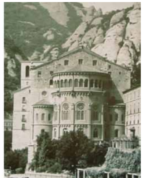
COMPARACIÓ DE LA FAÇANA POSTERIOR DE LA BASÍLICA ABANS (1850) I DESPRÉS DE LA INTERVENCIÓ (1910) DELS ARQUITECTES VILLAR CARMONA (PARE I FILL), QUE VAN AFEGIR TRES ABSIS SEMICIRCULARS D'ESTIL NEOROMÀNIC I VAN MODIFICAR EL PENDENT I L'ALÇADA DE LES COBERTES AFEGINT UN NIVELL EXTRA A LA COBERTA. AQUESTS AFEGITS VAN PROVOCAR LA DESPROPORCIÓ AL VOLUM ORIGINAL DE LA BASÍLICA