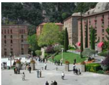
VISTA D'ABANS I DESPRÉS DEL NOU ACCÉS (2004) DEL MUSEU DE MONTSERRAT, PERFECTAMENT INTEGRAT AL CONTEXT